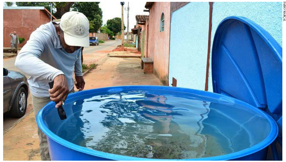
Os agentes durante a inspeção da caixa d'água

- Providenciar limpeza periódica (1 vez por semana) e vedação de tambores, tanques e qualquer outro tipo de reservatório ao nível do solo, usando a água em período menor que o ciclo de reprodução