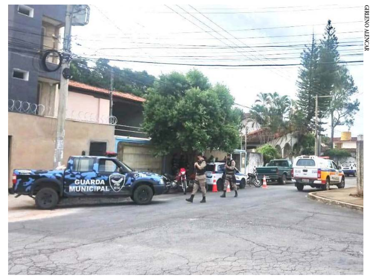
A Polícia Militar e a Guarda no local