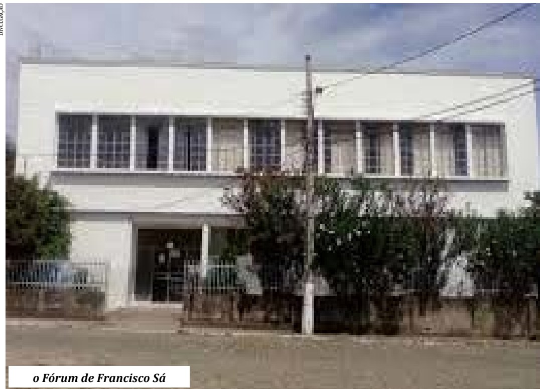
o Fórum de Francisco Sá

O Tribunal de Justiça de Minas Gerais anunciou que a comarca de Francisco Sá passará a