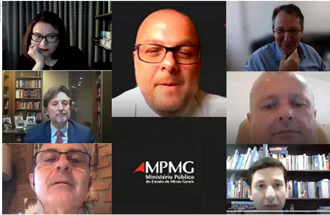
A videoconferência que discutiu o assunto