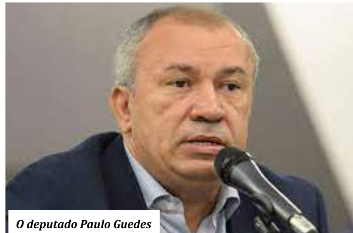
O deputado Paulo Guedes

vulnerabilidade ou com dificuldade de acesso a plataformas digitais; promove descentralização do pagamento do auxílio, mantém as sanções para o recebimento indevido e dá outras providências. O deputado Paulo Guedes ressalta que, nos últimos anos, a desigualdade e a extrema pobreza vêm numa crescente no Brasil, provocando sérios efeitos sociais no trabalho e na renda dos brasileiros. "A pandemia piorou esse cenário econômico, com a diminuição do emprego, o fechamento de empresas e o ataque direto aos trabalhadores autônomos, mas não há dúvidas de que Bolsonaro aprofundou esse caos", afirma.