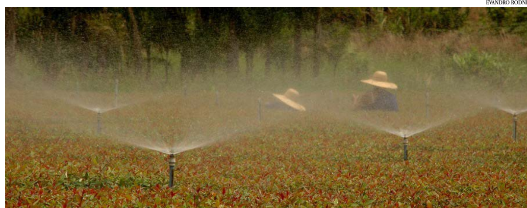
Novas regras sobre cobrança por uso de recursos hídricos foram publicadas pelo Governo do Estado