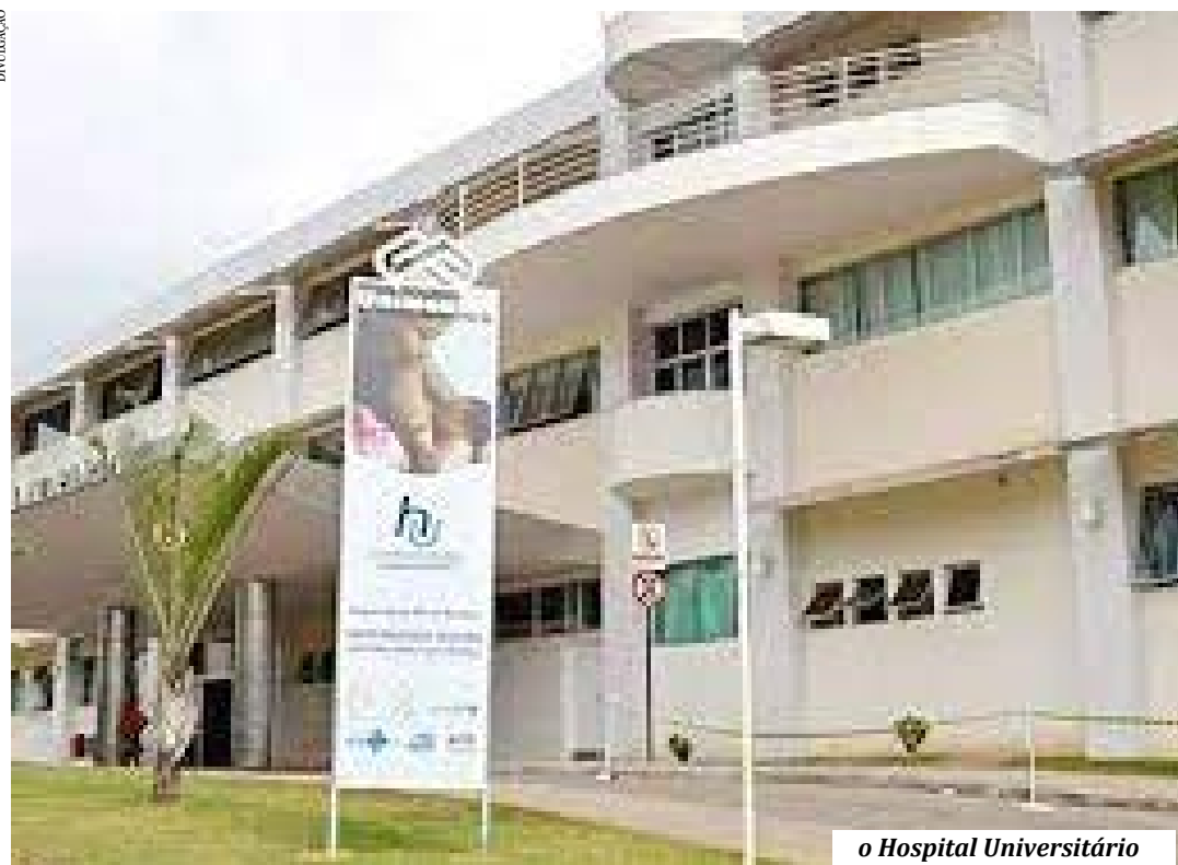
o Hospital Universitário