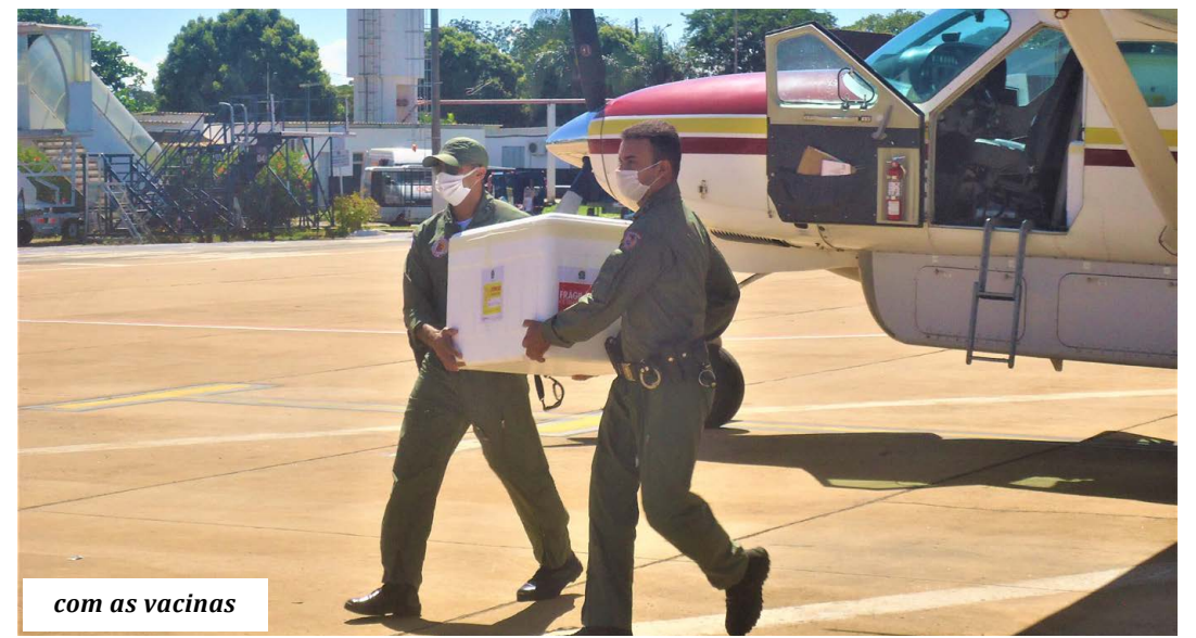
com as vacinas

Até a manhã de ontem (25), dados contabilizados pela Secretaria de Estado da Saúde de Minas Gerais pela plataforma informatizada vacinômetro, revelam que aumentou para 73.574 as pessoas residentes