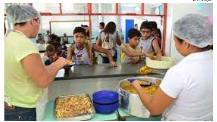
Ensino de Jovens e Adultos; 17.331 fundamental integral e 620 da educação especial. (GA)

conforme padronização dos cardápios elaborados para o ano de 2021, bem como de acordo com o número de alunos matriculados e informados junto ao Programa Nacional de Alimentação conforme disponibilizado pelo FNDE/ Ministério da Educação. São 29.351 alunos, sendo 534 alunos da Educação Infantil que permanecem nas Unidades por tempo integral; 2.426 alunos parcial creche Alunos do Maternal I e Maternal II; 7.739 parcial pré creche Alunos dos 1º e 2º Períodos do Ensino Infantil; 629 do