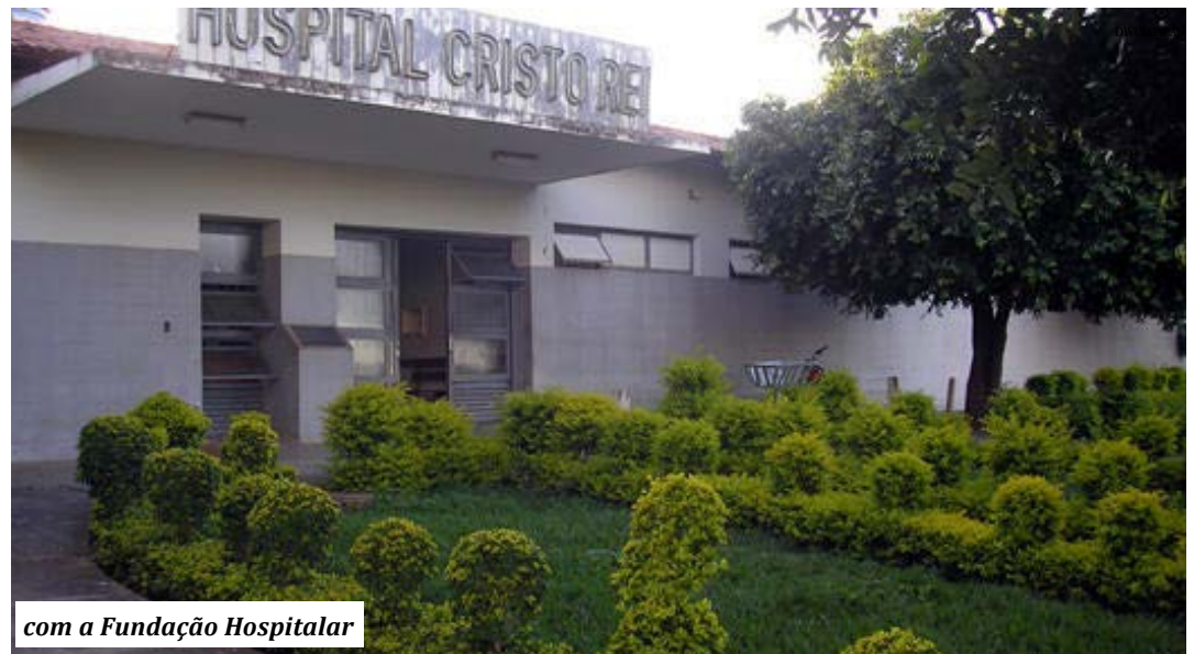
com a Fundação Hospitalar

Ela salienta que "a despeito de tudo quanto exposto, com a devida cautela e responsabilidade, cabe a sra. Gerente Regional indicar outro membro para composição da Comissão, como já deveria tê-lo feito quando peticionou pela exclusão, sob pena de desobediência