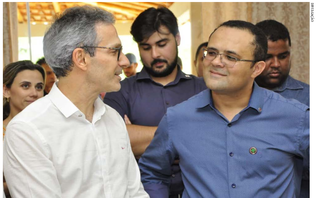
com o deputado Zé Reis e governador

No ano passado, o Estado adiou por duas vezes o aumento da tarifa do pedágio, depois que realizou acordo com a concessionária Eco135. A primeira suspensão do aumento foi por 90 dias e depois por mais 60 dias. A medida foi alinhada com as ações adotadas pelo Comitê Extraordinário do Covid, para tratar e mitigar as consequências fiscais, econômicas e financeiras provocadas pela pan-