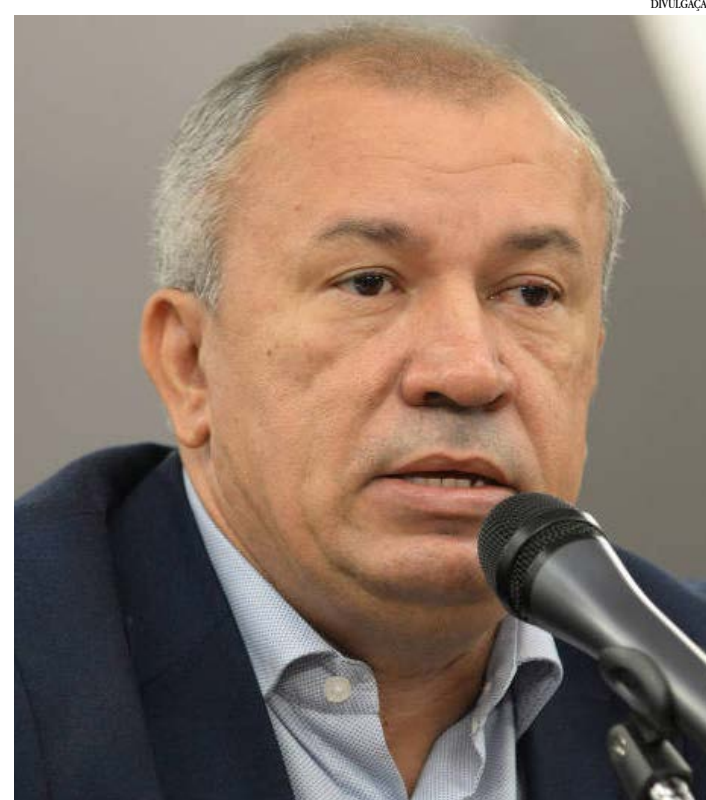
O deputado Paulo Guedes

"De acordo com a pesquisa, a insegurança alimentar grave –