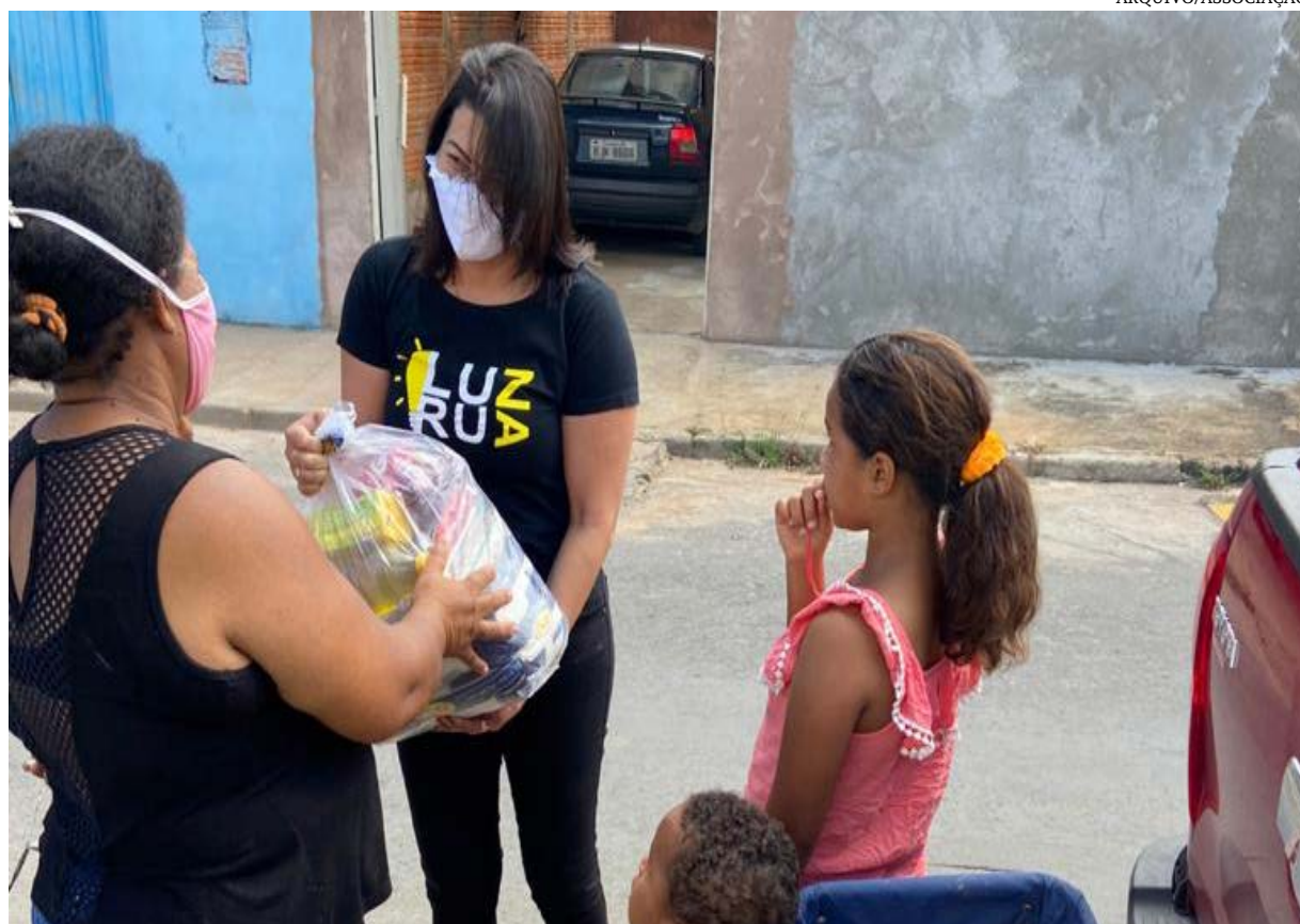
A entrega de cesta básica para família carente

A Associação 'Luz na Rua' surgiu através de ações dos membros da Igreja Cristã Graça e Paz e, atualmente, conta com a participação voluntária de 200 membros que têm o propósito de servir. No último domingo (21), foram assistidas 30 famílias, um total de 108 pessoas, com a entrega de 30 cestas básicas, kits de higiene pessoal, álcool em gel, máscaras e roupas.