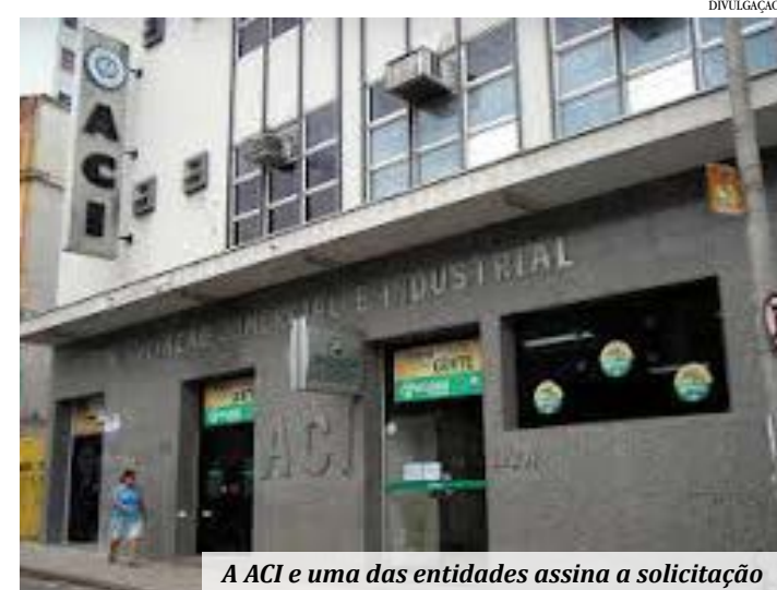
A ACI e uma das entidades assina a solicitação