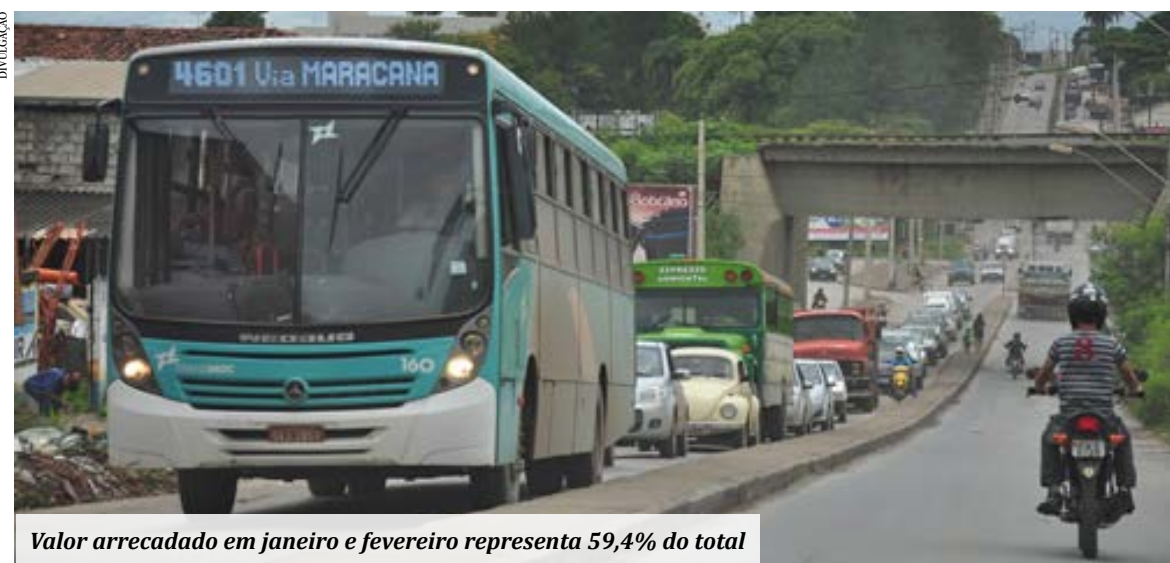
Valor arrecadado em janeiro e fevereiro representa 59,4% do total

A Superintendência de Arrecadação e Informações Fiscais da Secretaria de Estado de Fazenda de Minas Gerais (SEF/MG) divulgou, ontem (15/3), o balanço parcial do IPVA pago em 2021. Até 28/2, foram arrecadados R$ 3,8 bilhões com o imposto, sendo R$ 2,8 bilhões em janeiro e R$ 1 bilhão em fevereiro. O montante representa 59,4% do total da arrecadação de R$ 6,4 bilhões prevista para este ano.