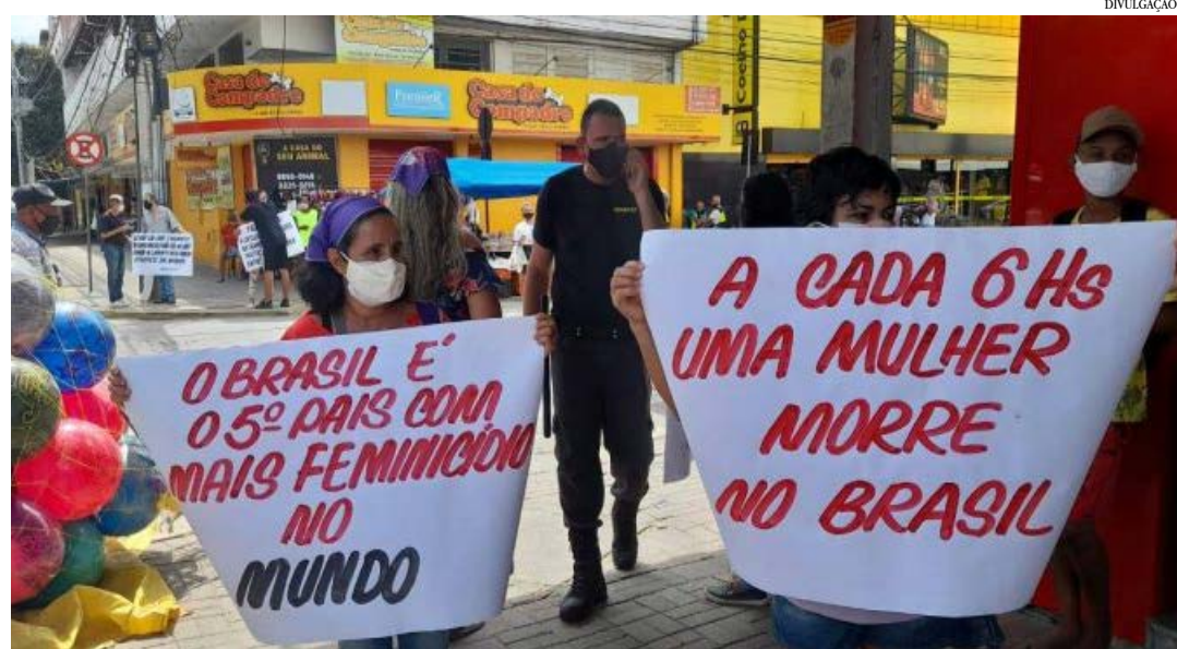
Entre as propostas que serão analisadas está a que cria o Formulário Nacional de Avaliação de Risco para mulheres vítimas de violência

Os deputados precisam votar as emendas do Senado ao texto aprovado pela Câmara em setembro de