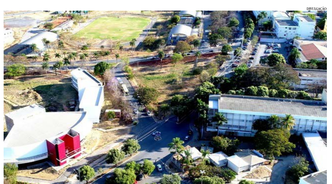
Candidatos podem se inscrever em 63 cursos superiores disponibilizados em dez sedes. Ao todo, são 720 vagas

Inscrições: de 12/2 a 12/3, pela internet, no site www.paes.unimontes.br .