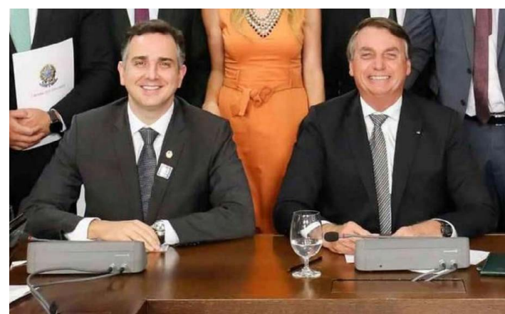
BOLSONARO FOI O VENCEDOR , a oposição fez tudo para que o chatíssimo Rodrigo Maia, que ninguém aguentava mais como presidente da Câmara elegeu o seu candidato que perdeu feio para o deputado Arthur Lyra. E o governo foi importante também na eleição do nosso presidente do Senado, Rodrigo Pacheco, aí em um momento de descontração com o presidente Bolsonaro. Tomara que eles trabalhem em prol do país, principalmente aprovando importantes emendas sem a eterna politicagem.