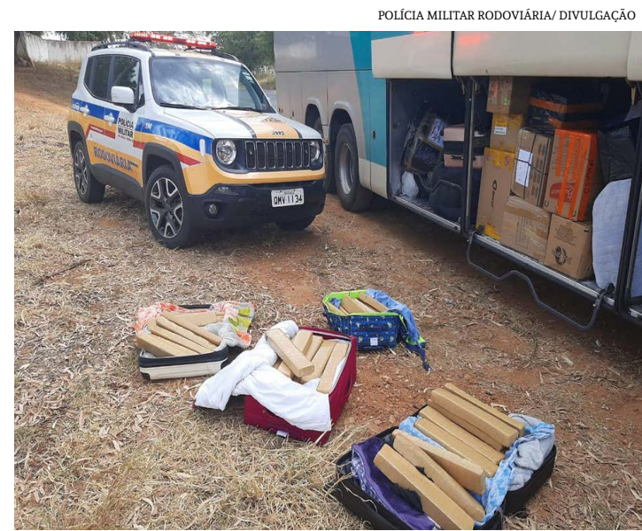
Maconha apreendida em Monte Azul estava dentro de malas

O GAZETA não conseguiu saber se as presas têm advogado até a última atualização desta reportagem. Se a defesa fora localizada, a matéria poderá ser atualizada.