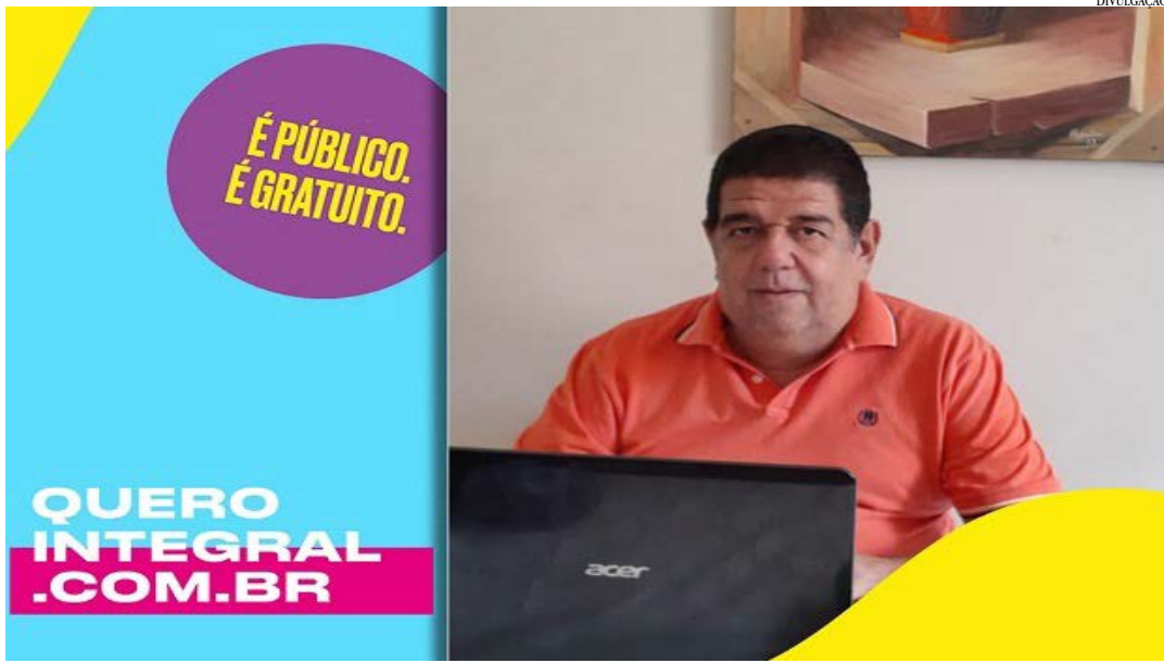
Estudantes interessados em uma vaga nas unidades de ensino que ofertam o EMTI podem consultar disponibilidade a partir de 25 de fevereiro

Ter a oportunidade de acompanhar mais de perto os alunos e, assim, poder saber identificar de forma mais natural as ações que estão dando certo e as necessidades de melhoria são possibilidades do Ensino Médio de Tempo Integral (EMTI) que mais encantam o professor de sociologia e de projeto de