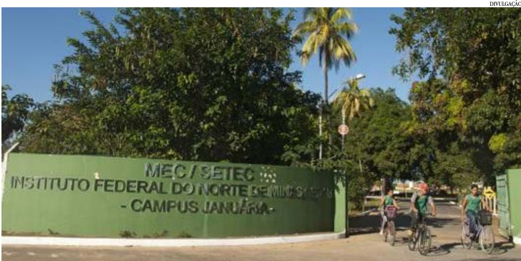
Interessados em participar dos programas devem ficar atentos pra não perder o prazo

Está aberto até quinta-feira (4/2) o período para os alunos das licenciaturas dos campi Janaúba e Salinas se inscreverem em cadastro de reserva para participação no Programa Institucional de Bolsas de Iniciação à Docência (PIBID) e no Programa de Residência Pedagógica (RP).