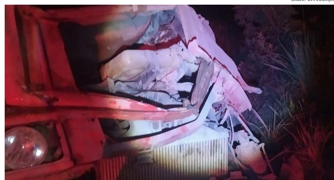
Caminhão bateu em um barranco

O acidente foi na altura do km-59 e o veículo transportava uma carga de cimento.