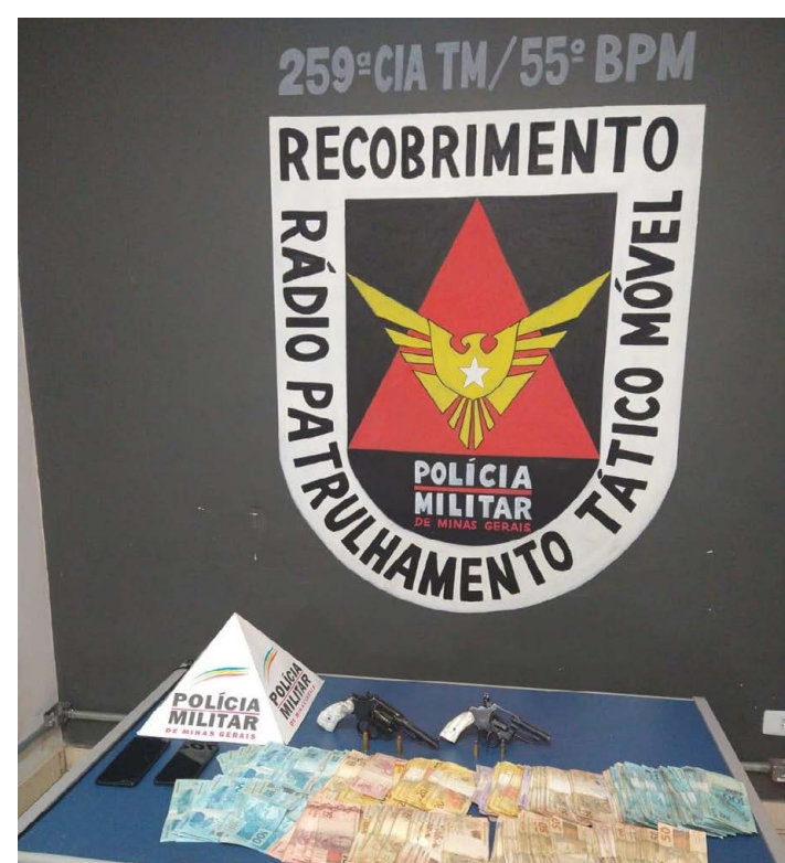
Dinheiro e armas apreendidas pela PM em Buritizeiro

A mulher foi presa em flagrante por furto e o homem foi detido por receptação. Eles foram levados para a delegacia da cidade.