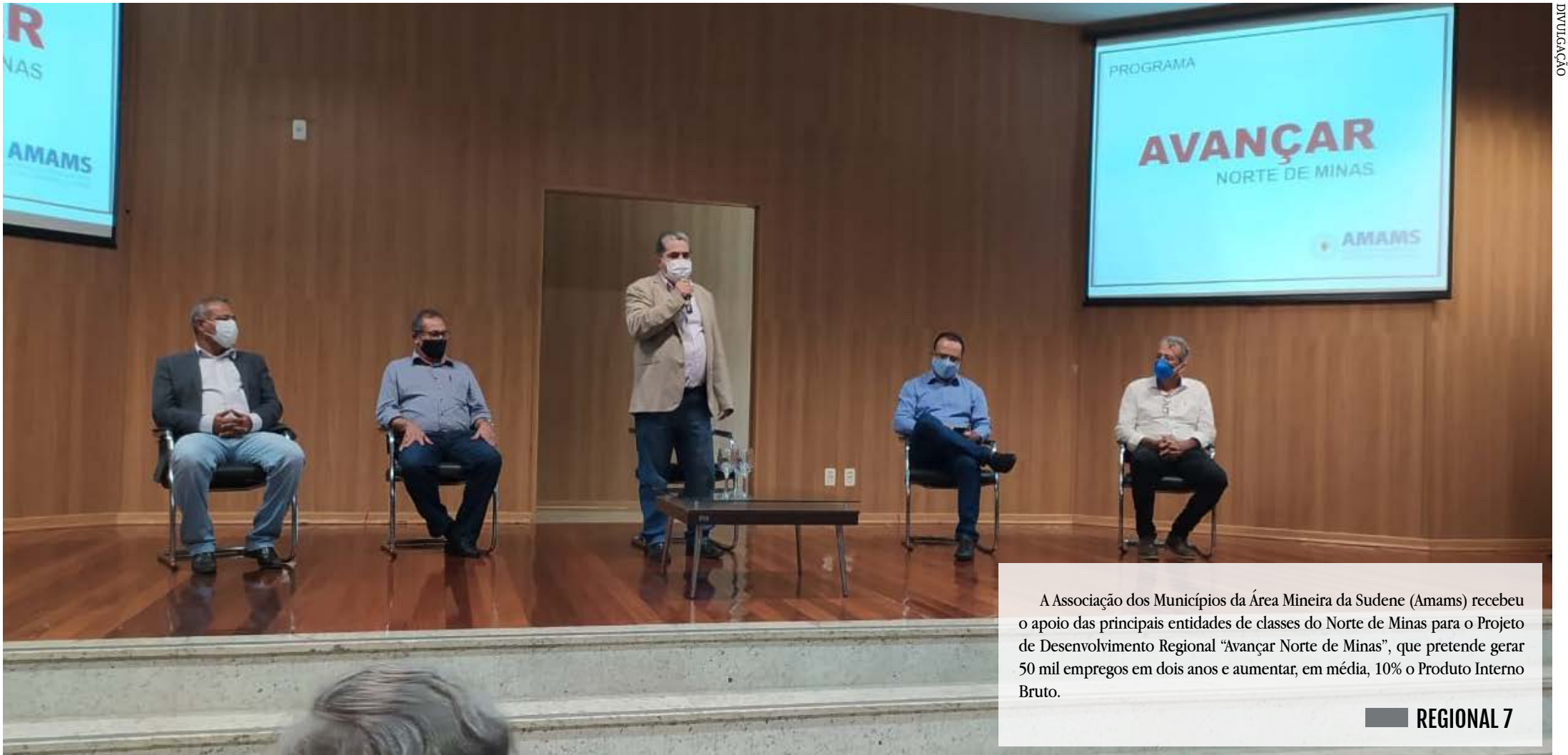
A Associação dos Municípios da Área Mineira da Sudene (Amams) recebeu o apoio das principais entidades de classes do Norte de Minas para o Projeto de Desenvolvimento Regional "Avançar Norte de Minas", que pretende gerar 50 mil empregos em dois anos e aumentar, em média, 10% o Produto Interno Bruto.