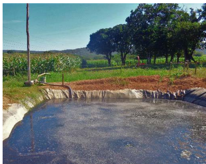
Projeto de produção de biofertilizante foi um dos contemplados com o Prêmio Hugo Werneck

Além de evitar danos ambientais, e até multas, o agricultor familiar conseguiu aumentar a renda da família, pois passou a receber uma quantia extra de um grande laticínio da região, que tem um programa de estímulo à produção sustentável de leite. E ainda tem a economia, pois deixou de comprar fertilizantes químicos para as pastagens e o plantio de milho. O projeto foi um dos contemplados de 2020 no Prêmio Hugo Werneck de Sustentabilidade & Amor à Natureza, considerado um dos mais importantes da ecologia no Brasil.