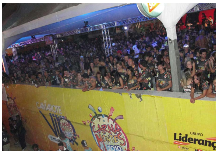
VEJA OUTRA FOTO, a vibração dos foliões nos camarotes que eram montados em dois andares.