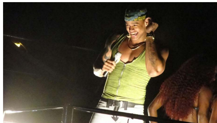
TODOS OS ANOS eram um verdadeiro desfile de shows em um TRIO ELÉTRICO com artistas famosos como: Ivete Sangalo, Claudia Leite, Chiclete com Banana, Léo Santana (foto) entre muitos outros.