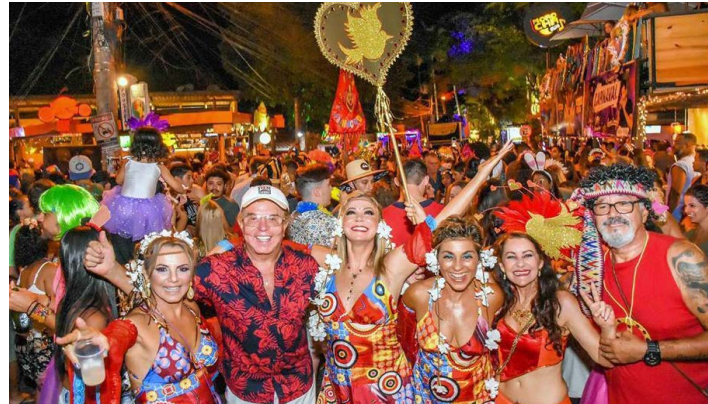
NO ANO PASSADO durante o CARNAVAL, estávamos em Dubai, e o último que curtir foi em Arraial d' Ajuda em 2019 que sempre foi dos mais animados e concorridos como estão vendo nesta foto. Infelizmente, devido a pandemia, não teremos este evento naquele paradisíaco local baiano, mas vou curtir o mar e meu "cantinho" onde faço diariamente minhas caminhadas na praia.