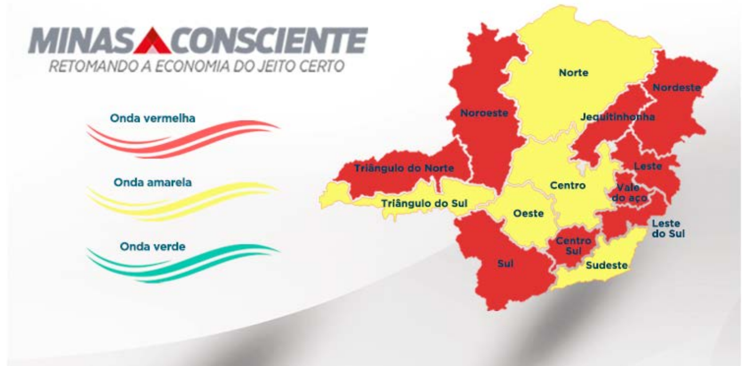
Recomendação foi homologada nesta quarta-feira (3/2) pelo Comitê Extraordinário Covid-19

do, de qualquer natureza, no período em questão, inclusive para aqueles de pequeno porte de que trata o protocolo para a onda vermelha;