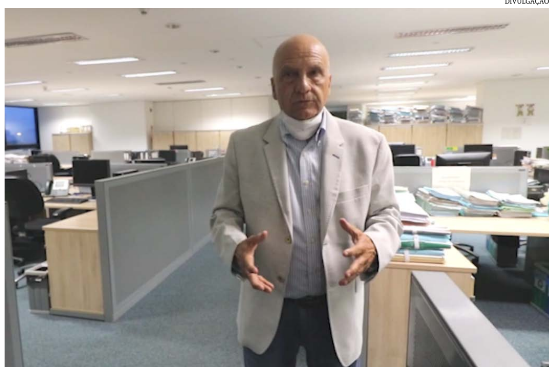
O parlamentar fala sobre a importância de benefícios na BR-135

ecções de obras muito importantes para Montes Claros, a construção dos anéis rodoviários Norte e Leste. "A Secretaria solicitará o apoio do exército para auxiliar as obras que, juntas, evitarão muitos acidentes e melhorará a mobilidade urbana de Montes Claros", destaca.