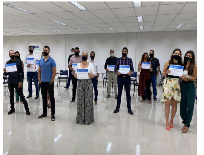
Aqui meus colegas empresários que também participaram do ALI recebendo seus certificados.