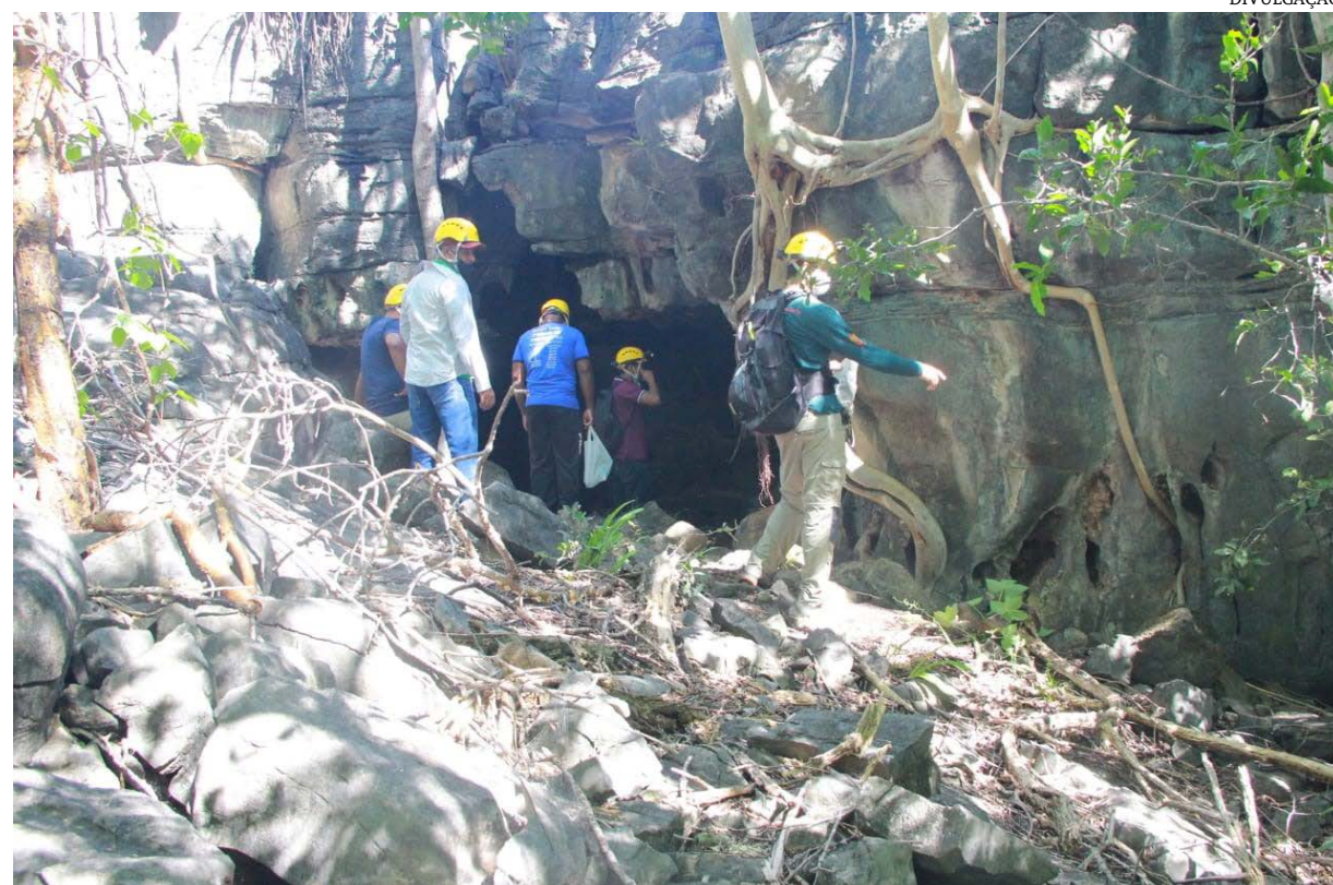
Uma das grutas da cidade norte mineira

A Secretaria Municipal de Turismo e Patrimônio Cultural de São Francisco criou um grupo para visitação nas cavernas existentes no município, com o intuito de fazer o levantamento do potencial turístico do local e inserir no inventário da oferta turística.