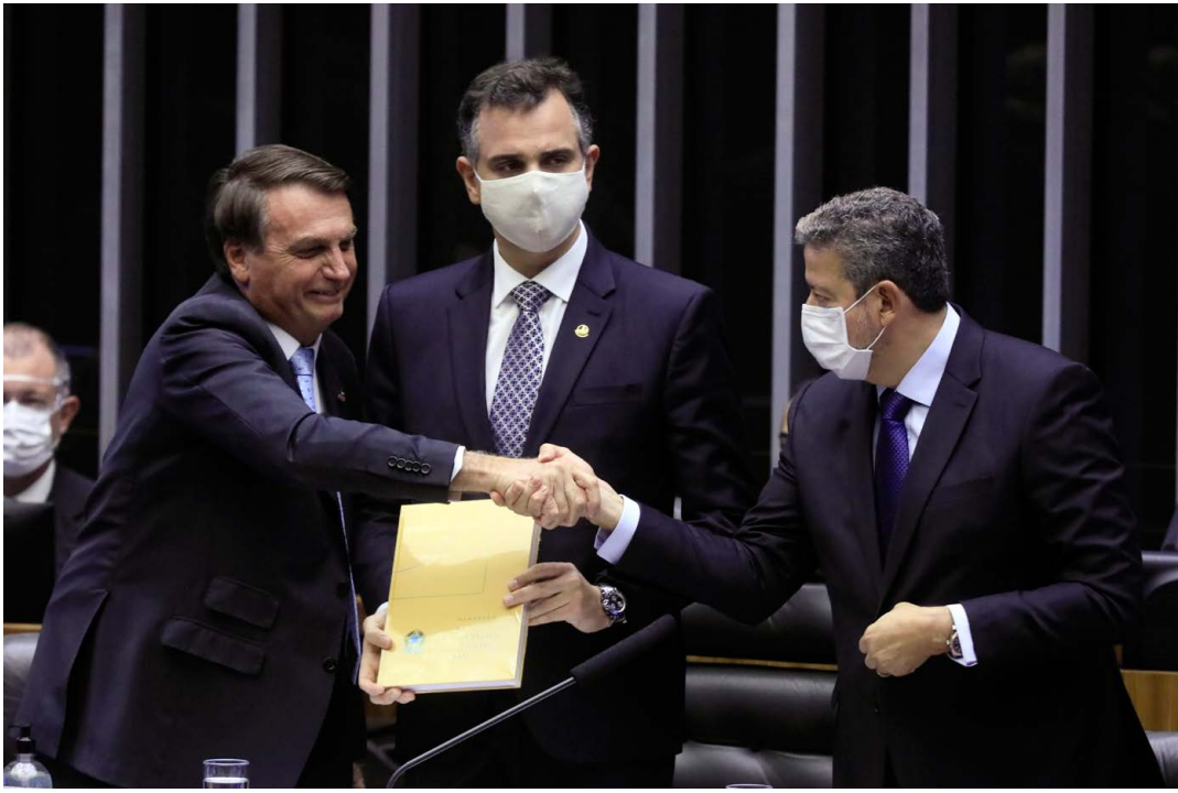
Bolsonaro, Pacheco e Lira reunidos na sessão de abertura do ano legislativo nesta quarta

O presidente Jair Bolsonaro entregou na quarta-feira (3) aos presidentes da Câmara dos Deputados, Arthur Lira (PP-AL), e do Senado, Rodrigo Pacheco (DEM-MG), uma lista de iniciativas legislativas prioritárias para o governo.