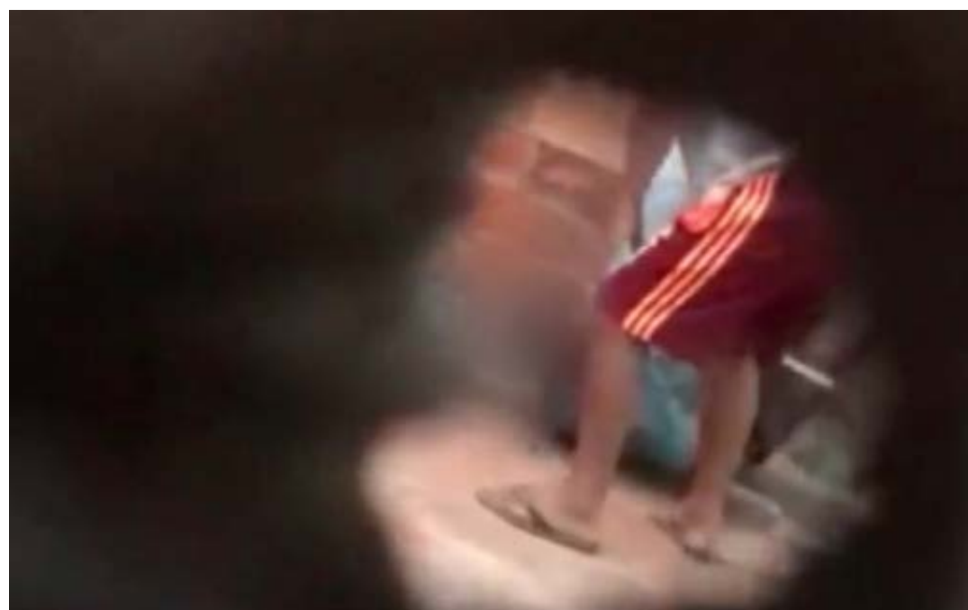
O momento em que o idoso, com as mãos e pernas amarradas, é arrastado pelo chão

As agressões teriam ocorrido cerca de uma hora após a chegada dele. "No momento da medicação, o paciente se recusou a usar