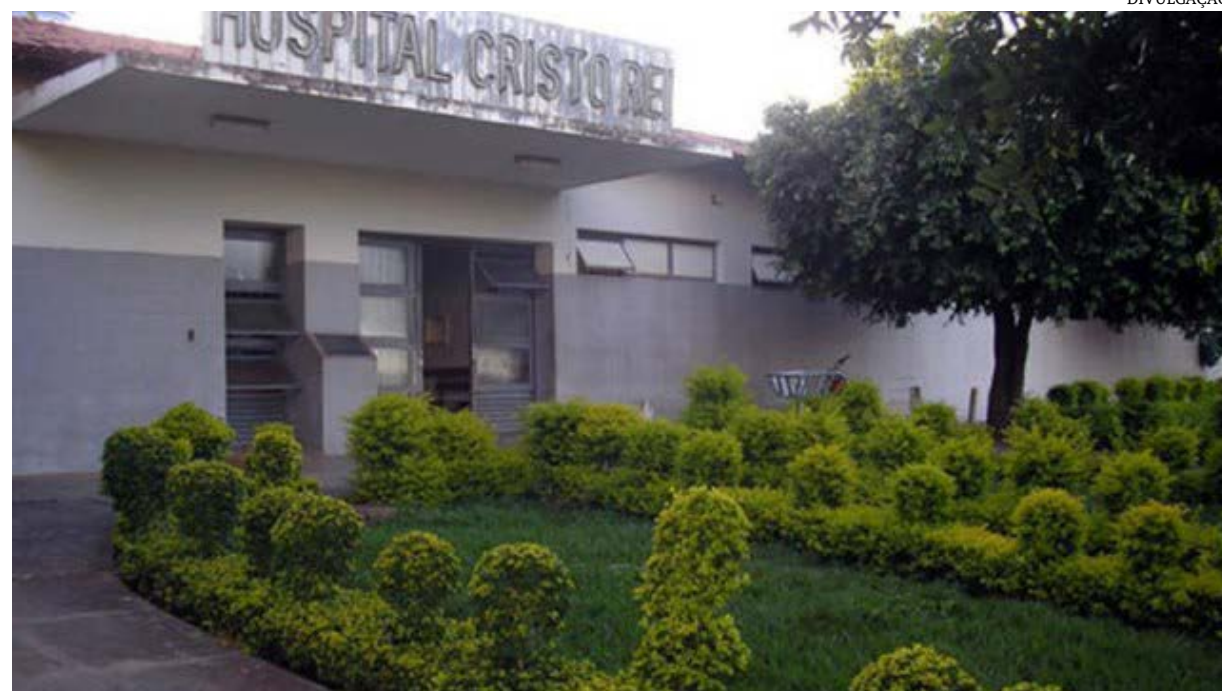
Fundação Hospitalar de Montalvânia, mantenedora do Hospital Cristo Rey está intervenção judicial