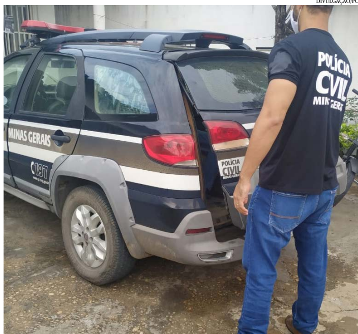
NO MOMENTO EM QUE O SUSPEITO ERA PRESO

A Polícia Civil de Minas Gerais (PCMG), em São João do Paraíso, Norte de Minas, prendeu, nesta quinta-feira (25), um homem de 34 anos, suspeito de estupro de vulnerável.