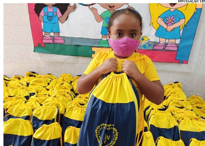
A doação dos kits de material escolar

Começou ontem e segue até hoje (24), a partir de 9h, a campanha entrega kits de material escolar para crianças, adolescentes e jovens de famílias em situação de vulnerabilidade em Montes Claros. As entregas acontecem em dois horários, com encerramento previsto às 16h.