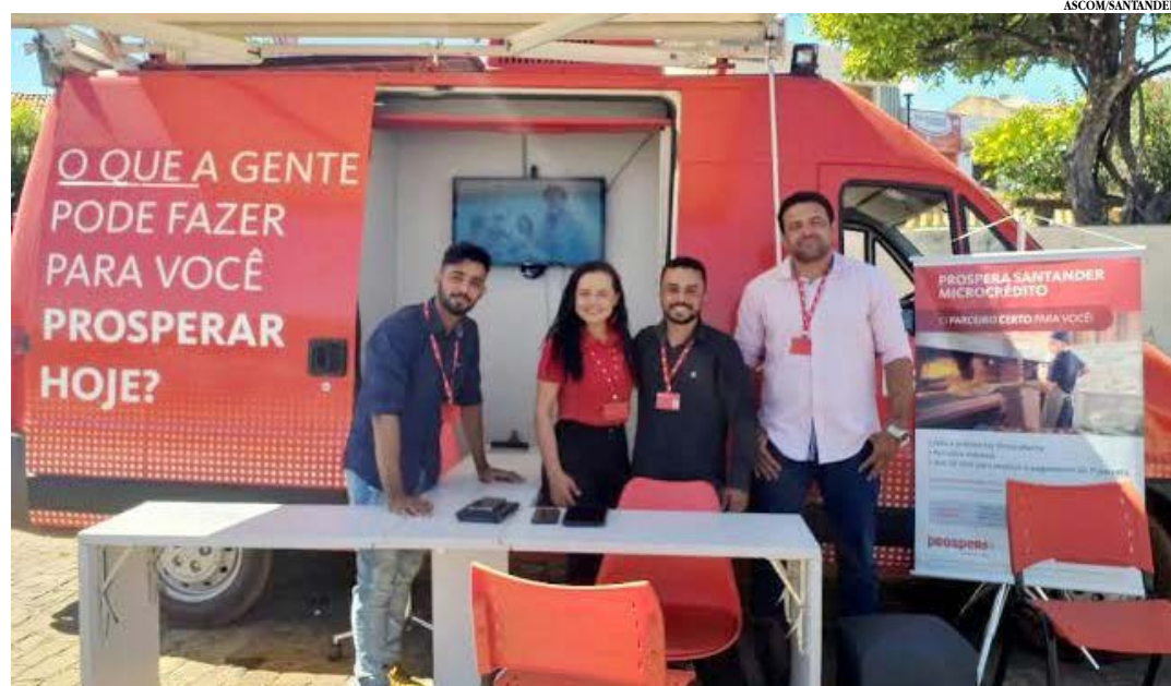
A Carteira no Norte de Minas conta com 23 mil clientes ativos; R$45 milhões em Carteira Ativa e uma aplicação histórica de R$230 milhões

É importante ressaltar, que o Santander está adotando todos os