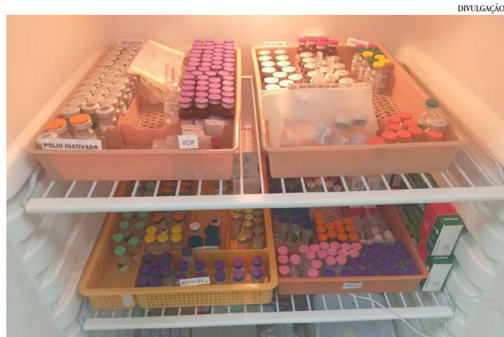
As doses que podem estar estragada

agendar o atendimento pelos números de WhatsApp (38) 99986-8684 ou (38) 3218-4144. (Com informações de Ascom/Santander)