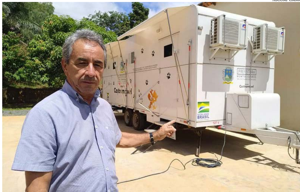
O parlamentar destaca a importância da ação em Montes Claros