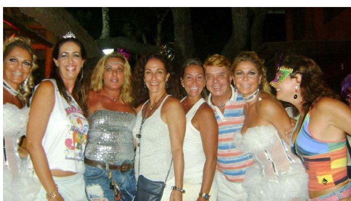
ESTE JORNALISTA cercado por um grupo de amigas que residem em Arraial.