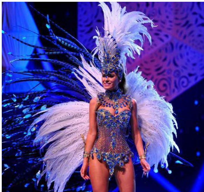
ESSA BRILHOU num dos carros alegóricos.