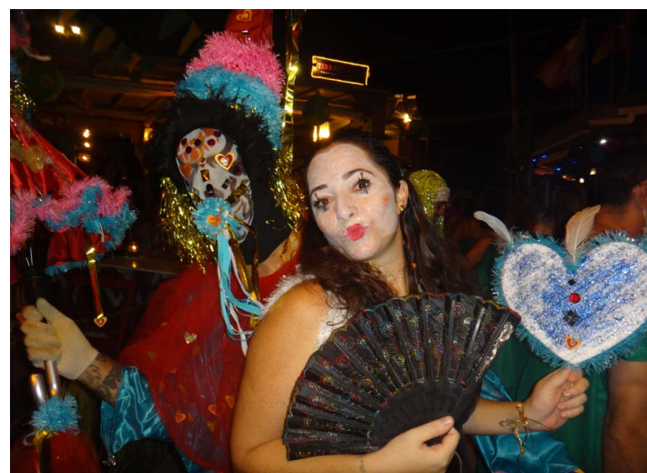
ESTE casal caprichou na fantasia.