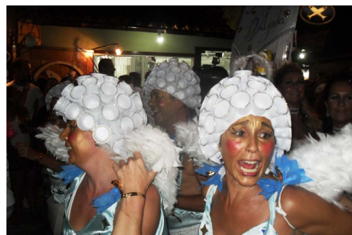
TODO MUNDO fantasiado e curtindo a folia.