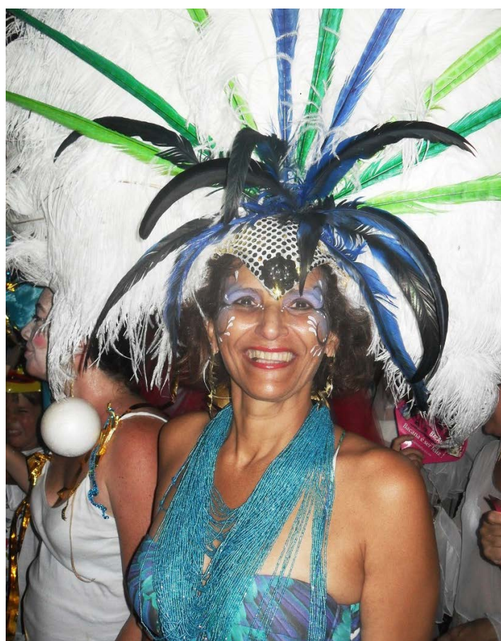
OS ADEREÇOS da cabeça sempre são destaque no Carnaval em Arraial.