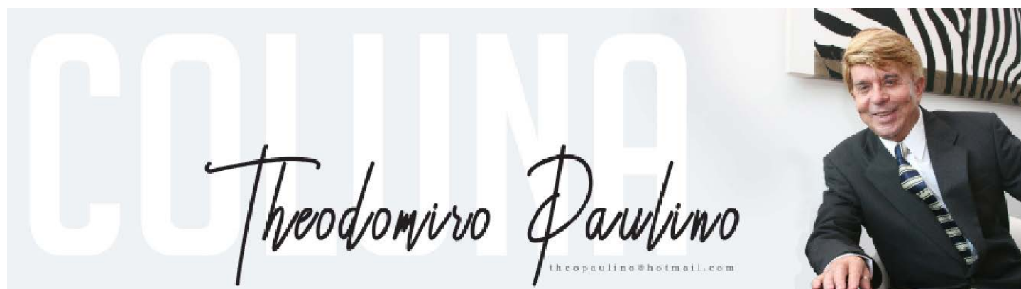
E COMO ESTAMOS em época de Carnaval, vou relembrar o daqui de Arraial, que é dos mais animados do sul da Bahia: