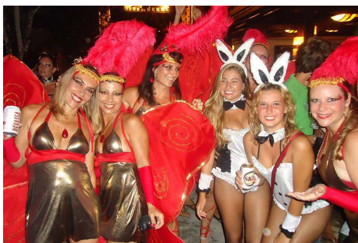
MUITA mulher bonitas com fantasias originais.