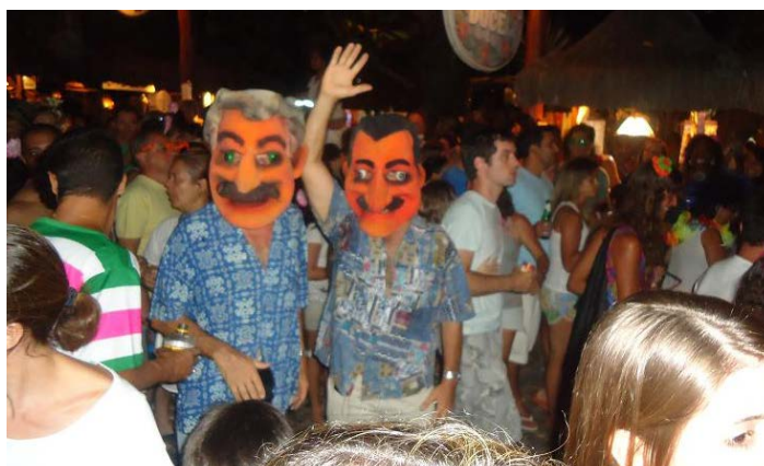
ESSA DUPLA fez um senhor sucesso.