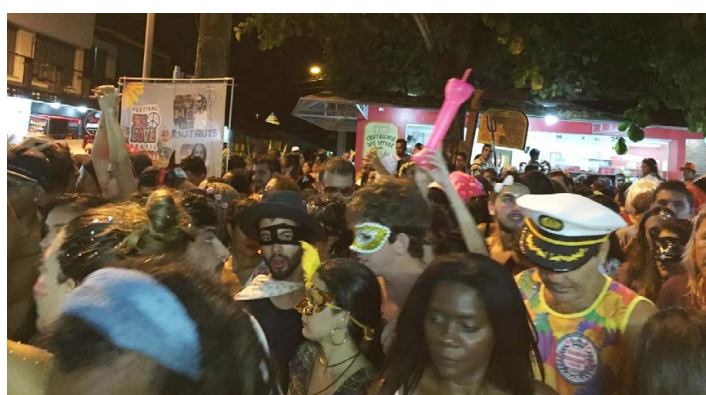
AS RUAS de Arraial sempre ficam super lotadas de foliões.