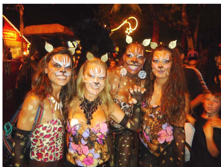
O BLOCO das gatas sempre presentes.