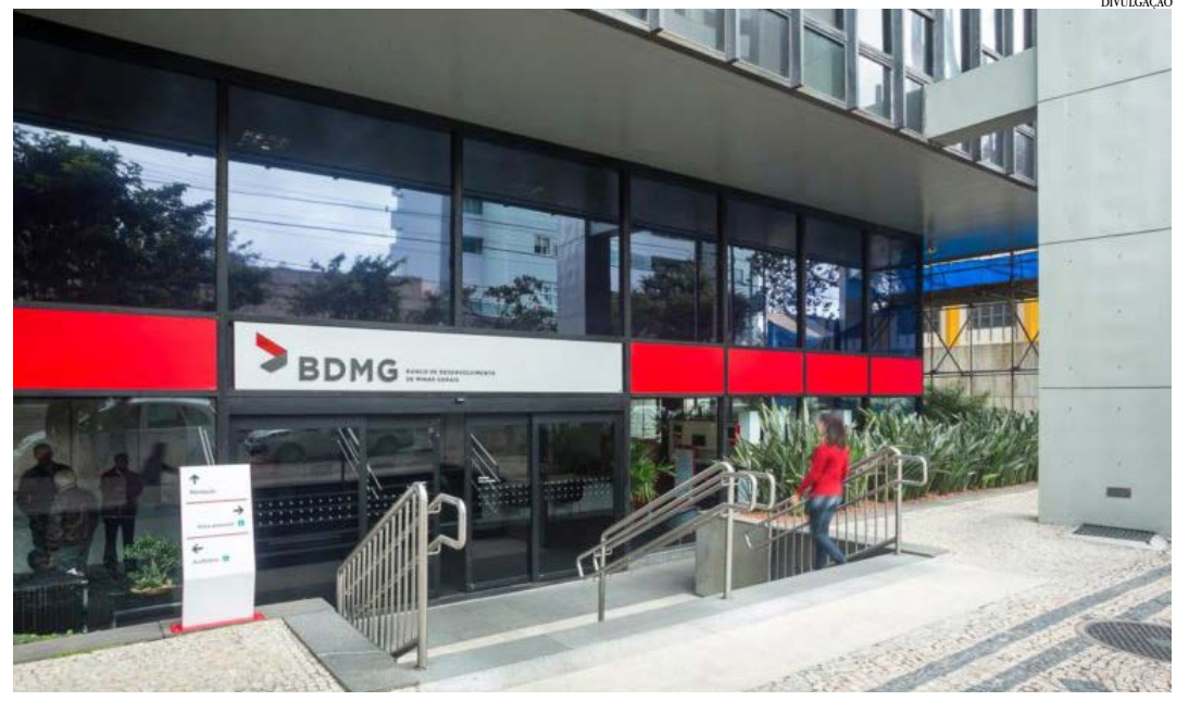
O aporte de recursos para cidades do Norte de Minas registrou alta de 145% em 2020