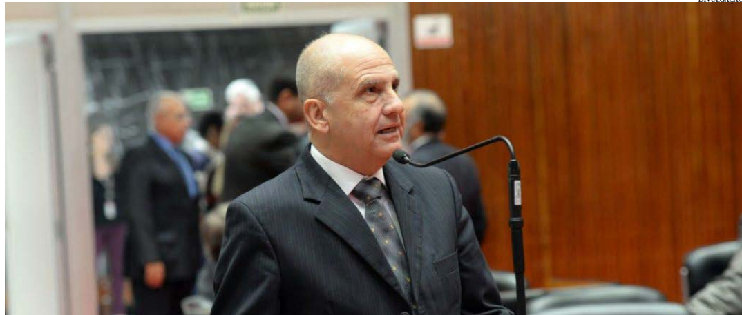
O parlamentar destaca a importância da obra para melhorar o abastecimento de Montes Claros

A tão aguardada obra que vai possibilitar a transposição da água do rio São Francisco para o abastecimento de água de Montes Claros deve sair do papel em breve. Isso porque, segundo a expectativa do deputado Arlen Santiago, a ordem de serviço da adutora São Francisco deve ser assinada pelo governador Romeu Zema ainda este mês.