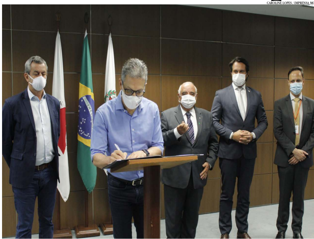
Lei Nº 24.747 possibilita à Administração Pública contratar pessoas físicas ou jurídicas para o teste de soluções inovadoras por elas desenvolvidas

A contratação citada por Passalio surge caso as metas definidas previamente no contrato de fomento para a inovação tecnológica