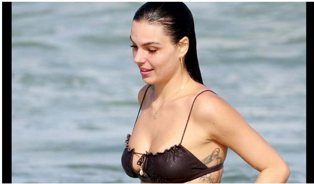
Isis Valverde foi criticada por ter seios pequenos e respondeu o comentário maldoso de forma firme. Confira!

De férias desde o fim das gravações da novela "Amor de Mãe", Isis Valverde vem compartilhando fotos de biquíni durante sua temporada em Trancoso, onde passou o réveillon, entre um mergulho no mar e um relax à beira da piscina. Em período de descanso com a família na Bahia, a atriz apareceu renovando o bronze e foi criticada por ter seios pequenos.