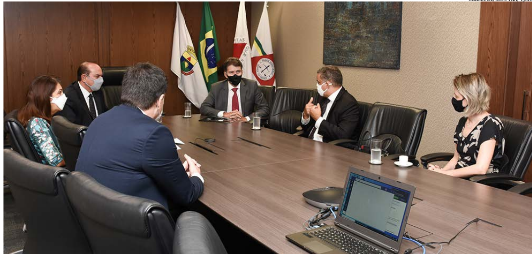
Tribunal de Justiça de Minas Gerais e Ministério Público Estadual acertam apoio recíproco a projetos

Ações visam atender egressos do sistema prisional, população em situação de rua e promover conciliações