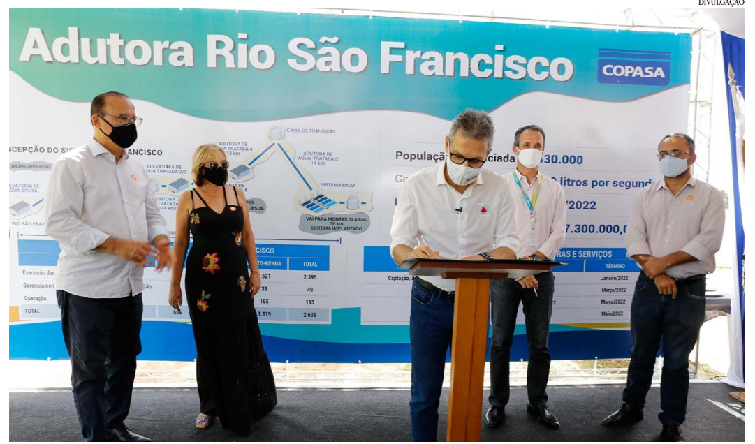
Zema destacou a importância da obra para o desenvolvimento do Norte de Minas