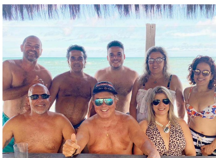
COM A ANIMADA turma.