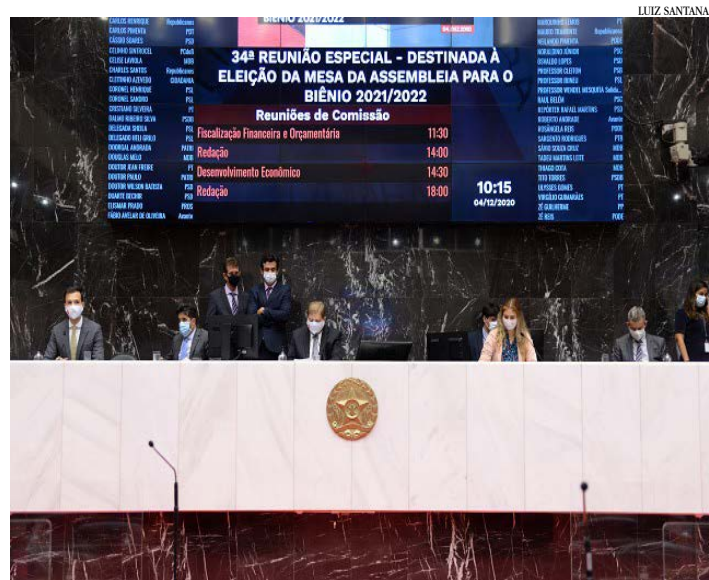
Em reunião no dia 4 de dezembro de 2020, a Mesa da Assembleia foi eleita. Os deputados que a compõem permanecerão na direção dos trabalhos até o final da legislatura