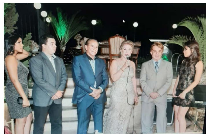
A ANFITRIÃ fazendo saudação para este jornalista.