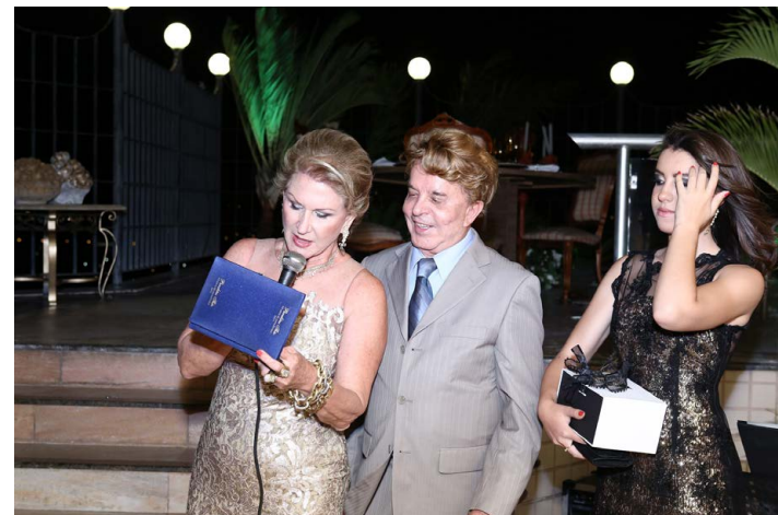
NOS ENTREGANDO uma placa de prata.