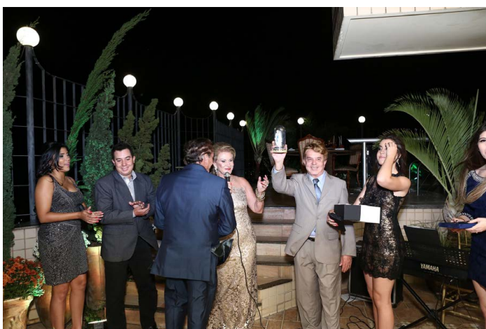
A BELA imagem de Nossa Senhora de Lourdes.