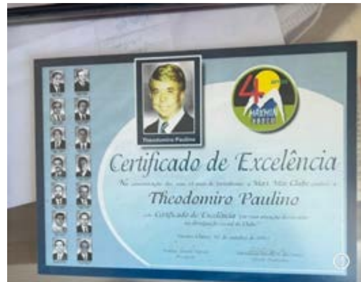
GUARDO COM MUITO CARINHO essa homenagem que recebi da diretoria do Max-Mim Clube em 2003