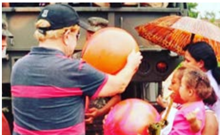
VEJAM OUTRO momento da CAMPANHA DO NATAL do ano passado. Conto novamente com a participação dos amigos, enviando um, dois ou mais brinquedos para minha residência.

A INESQUECÍVEL , Martha Rocha, considerada a mulher mais bela da história brasileira em dois tempos: Quando veio para festa dos meus 30 anos de jornalismo e quando foi jurada do "Baile da "Glamour- Girl".