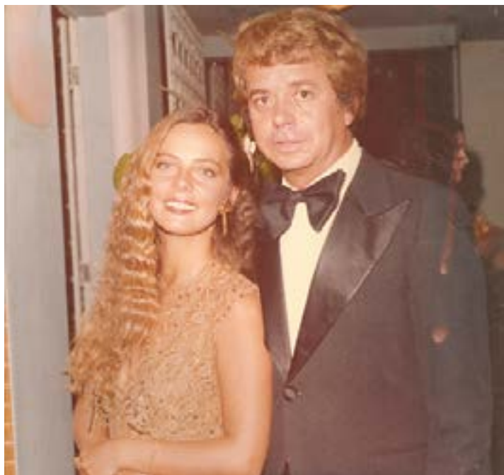
ETERNO GLAMOUR – Nunca podemos esquecer que durante quatro décadas o BAILE DA GLAMOUR–GIRL foi a festa mais elegante das Gerais, no AC. Hoje estou relembro quando uma das maiores belezas do Brasil, BRUNA LOMBARDI, veio a Moc ser jurada no Baile da Glamour–Girl com este jornalista