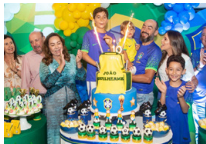
NA HORA DOS PARABÉNS, cercado pela família