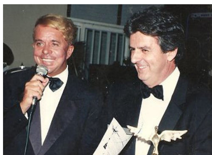
EM SETEMBRO, estarei finalmente comemorando o JUBILEU DE OURO, do evento de premiações mais importante e tradicional das Minas Gerais, que modéstia à parte, a noite das PERSONALIDADES DO NORTE DE MINAS que nos últimos 50 anos trouxe inúmeros nomes importantes da política Brasileira. Veja quando o então ministro, Walfrido dos Mares Guia veio receber a importante homenagem.